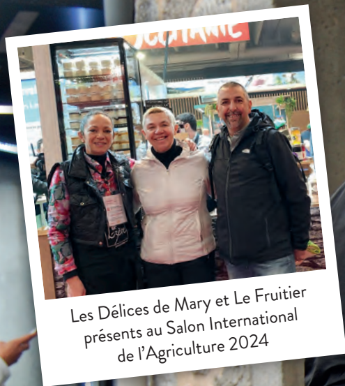
Les Délices de Mary et Le Fruitiier présents au Salon International de l'Agriculture 2024